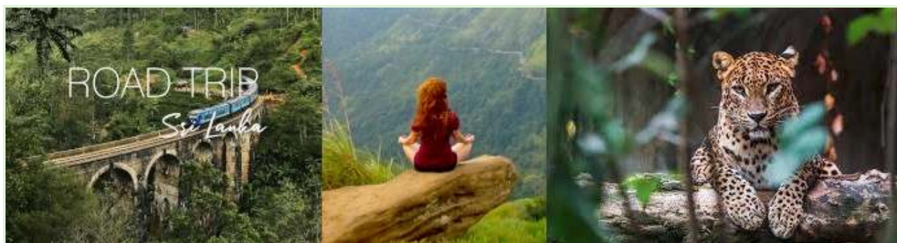
Vacanțe în Sri Lanka - Tururi și expediții cu ghid în natură

Timp: Experimentul a fost lansat în timpul pandemiei de COVID-19, când economia Sri Lanka dependentă de turism a fost deja grav afectată.