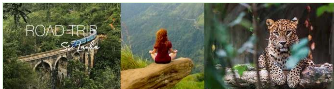
Vacanțe în Sri Lanka - Tururi și expediții cu ghid în natură

Timp: Experimentul a fost lansat în timpul pandemiei de COVID-19, când economia Sri Lanka dependentă de turism a fost deja grav afectată.